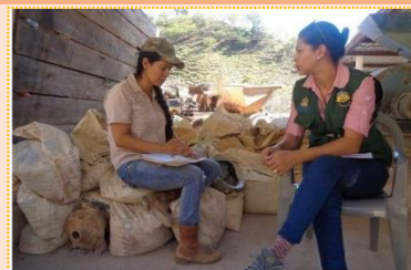
25 de Enero Día Nacional de la Mujer Hondureña FELICIDADES A LA MUJER MINERA HONDUREÑA

El empoderamiento de la mujer en el ambiente minero está rompiendo mitos, estereotipos y barreras. Un sector que por años fue exclusivo para hombres, hoy día incluye el servicio profesional de geólogas, ingenieras y equipo técnico de distintas ramas, para realizar funciones en puestos de proyectos mineros en Honduras.